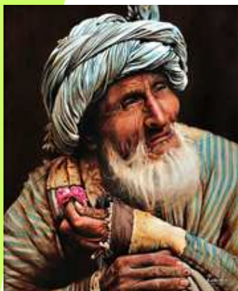
Tableau d'Hachem Barakzaï, à partir de la photo de Sabrina et Roland Michaud.