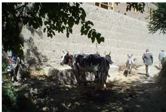
Un paysan ayant 2-3 têtes de bétail est considéré riche