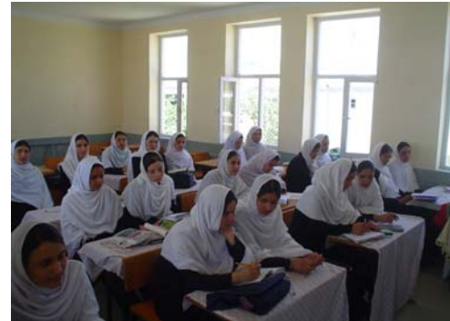
L'unique classe de terminale : 28 élèves

Parallèlement, elles nous ont sollicitées pour la mise en place de cours de préparation au concours d'entrée à l'université (6) .