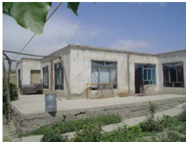
Tchelsetoun : avant la pergola et ..... Après