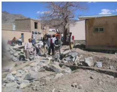
Fondations Avril 07

Il s'agissait de mettre à la disposition du lycée une bibliothèque, un laboratoire et une crèche pour les enfants des enseignantes (150 m 2 au total) ainsi que de construire un mur de 80 m de long sur 2m de haut pour finir de clore l'enceinte du lycée.