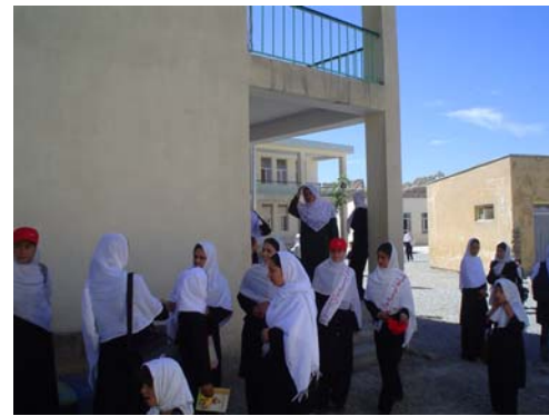
Certaines filles de première et de terminale (casquette rouge) en charge de la discipline (...)