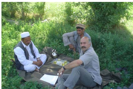
Discussions avec un propriétaire terrien et l'un des paysans du programme pilote.