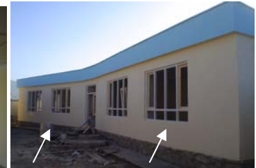
Bibliothèque et crèche