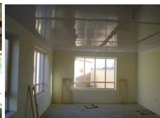
une des 3 salles de 9 m x 5 m