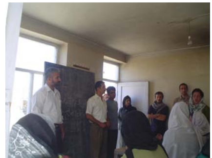
Introduction au séminaire de formation en math, animé par l'ONG Afrane

Lors des visites de classe nous avons en effet constaté que chaque élève avait son cahier, ce qui permet aux enseignants d'avoir enfin un support d'évaluation. Des sessions de sensibilisation ont été organisées dans les classes sur l'usage et le rôle du cahier.