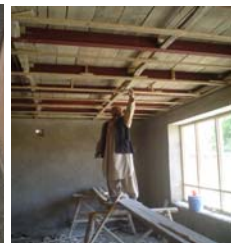
Pose du plafond