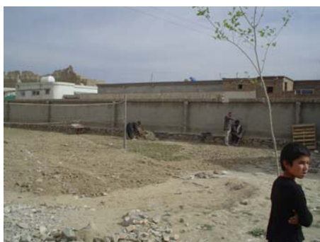
Réhabilitation du terrain de volley et plantation de gazon.

Faute de terrain et de véritable prof. d'éducation physique, les filles n'exerçaient aucune activité sportive. Les élèves de terminale et de première, soutenues par la direction, nous ont donc sollicité pour réhabiliter le « terrain » de sport.