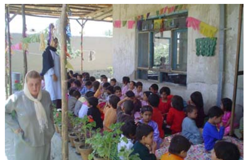
Tchelsetoun- Fête de la Journée de l'Enfant : danse, chant, goûter sous la nouvelle pergola