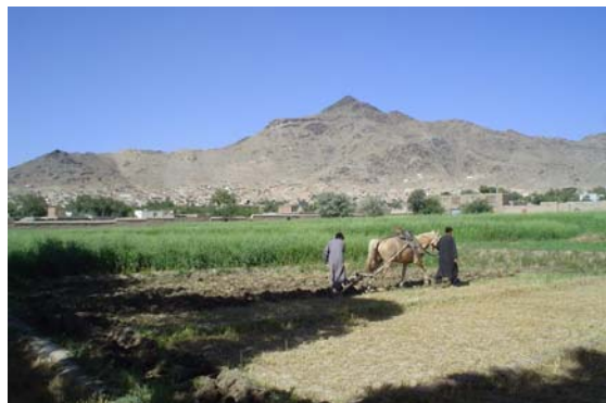
Une des terres qui sera exploitée dans la phase pilote