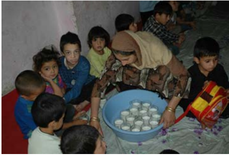
Distribution de lait