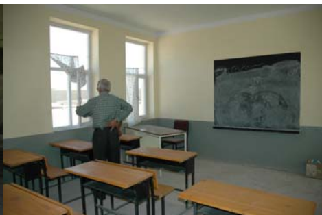
Nouvelle classe ouverte en 2006