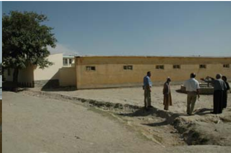
Emplacement pour futurs locaux