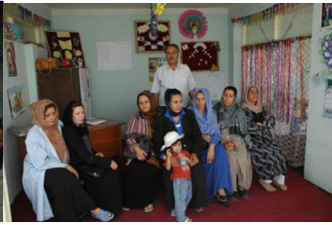
Enseignantes de la maternelle Ali-shams