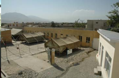
Cour du lycée