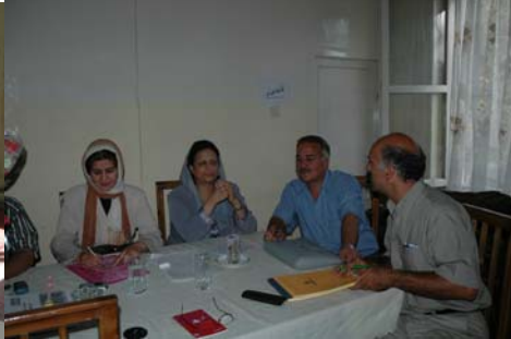
Réunion avec la directrice nationale des maternelles