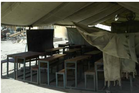
Salle de classe sous tente