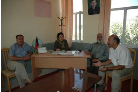
Lycée de Chelsetoun