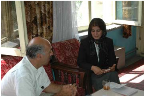
Responsable pédagogique DN des maternelles