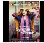
Atiq Rahimi prix Goncourt pour son roman Pierre de patience (Syngué Sabour)

Organisée par Ensemble pour l'Afghanistan en collaboration avec le Méliès