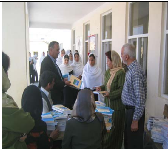
Distribution de fournitures scolaires