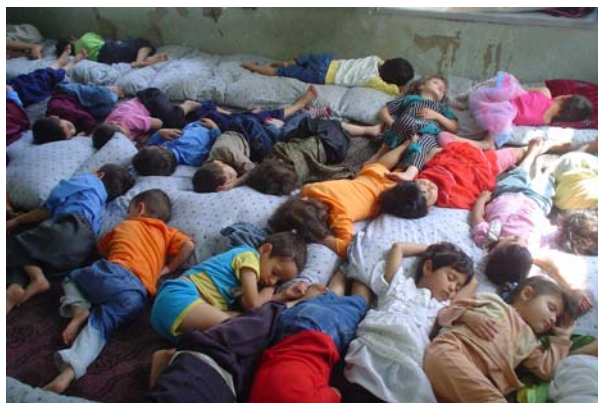
Sieste à Ali Shams dans classes saturées