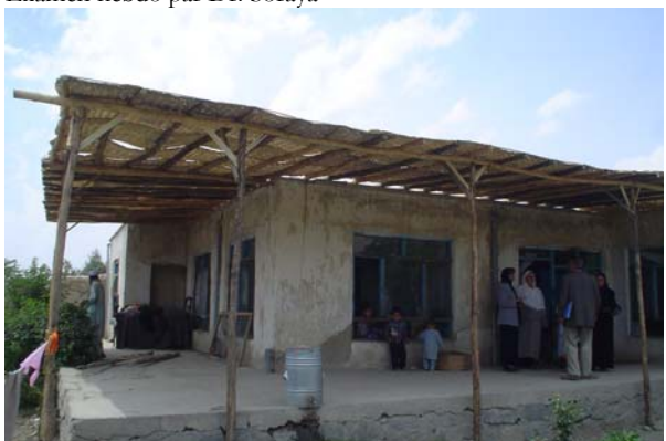
Tonnelle de Tchelsetoun