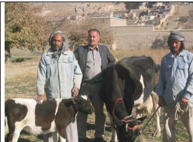
Notre coordinateur et 2 des 5 paysans ayant bénéficié du crédit