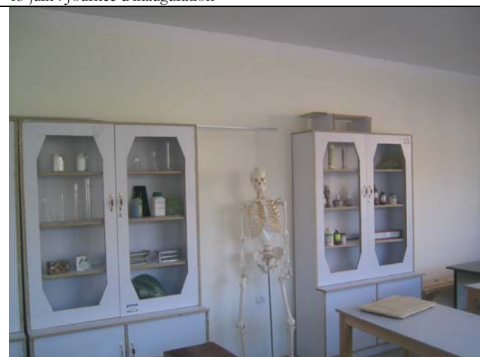
Le labo construit par EPA