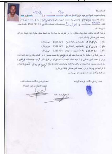
exemple d'un des actes de crédit