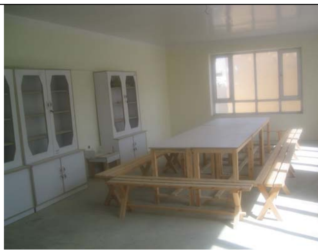
Vue d'ensemble du labo : pièce de 45 m 2