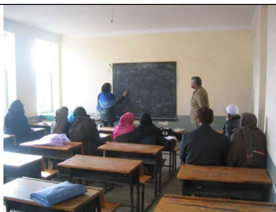
Formation des enseignants en Maths.