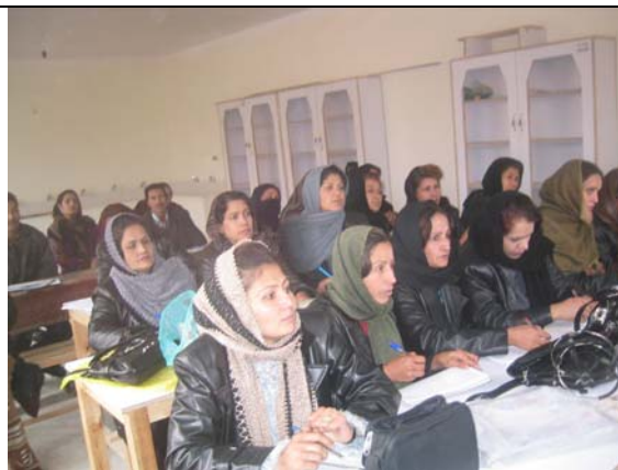
Formation de Persan pour les enseignants