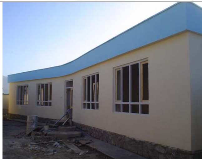
Bloc pédagogique : phase finale des travaux