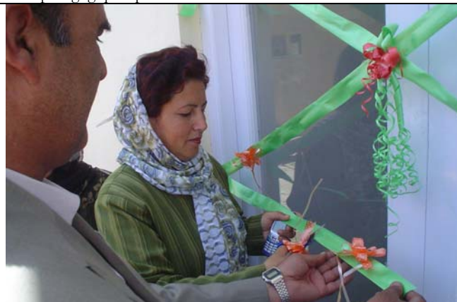
Inauguration des locaux par le Directrice