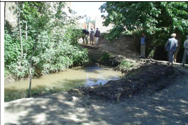
Visite des terres destinées aux paysans et du système d'irrigation