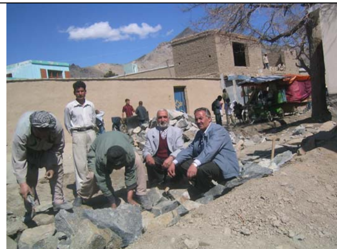
Fin mars : Notre coordinateur lors des travaux de fondation