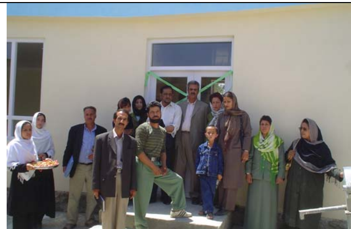
13 juin : Journée d'inauguration