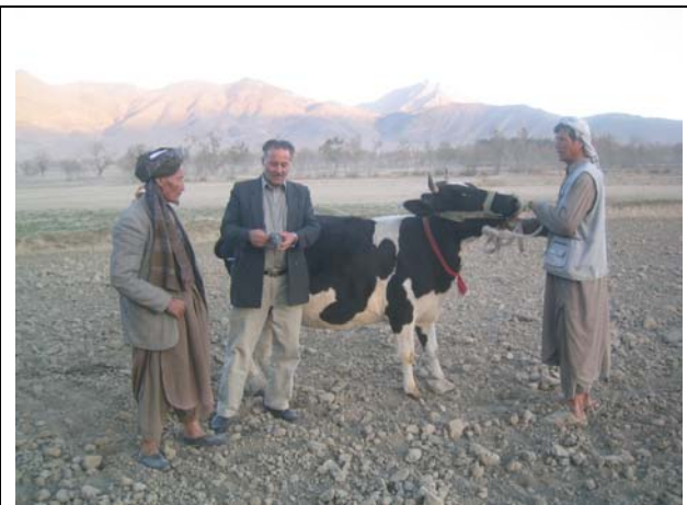
Achat de vaches par notre coordinateur et le bénéficiaire