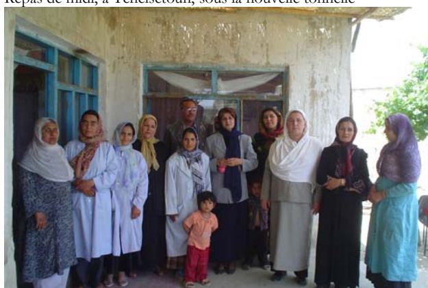
Instits et personnel de Tchelsetoun