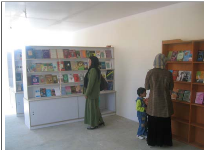
Bibliothèque construite par EPA