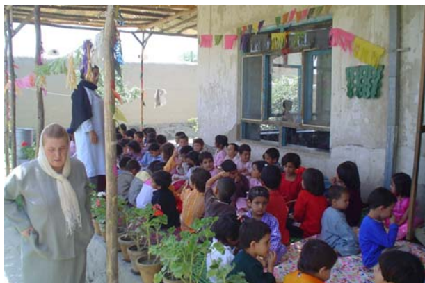
Repas de midi, à Tchelsetoun, sous la nouvelle tonnelle