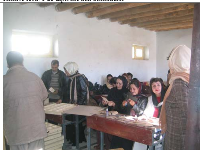
Formation de Persan : constitution de puzzle alphabétique