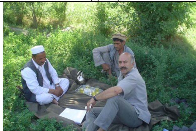
Discussion avec un propriétaire terrien et le paysan bénéficiaire