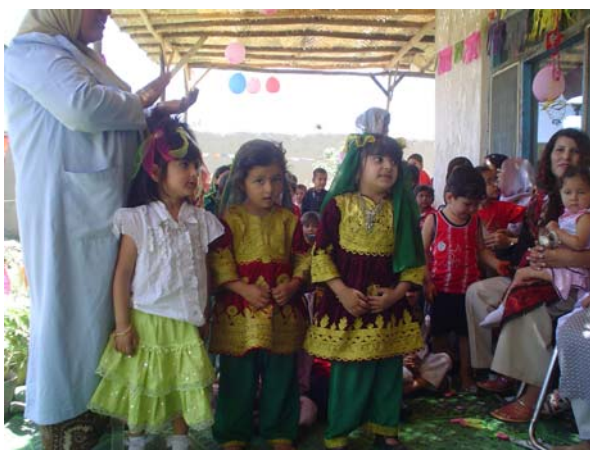
Journée de l'Enfant fêtée à Tchelsetoun