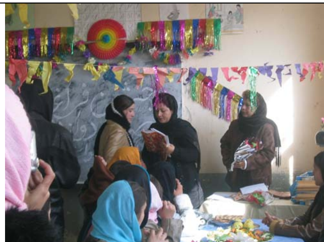
Remise festive de diplôme aux bacheliers